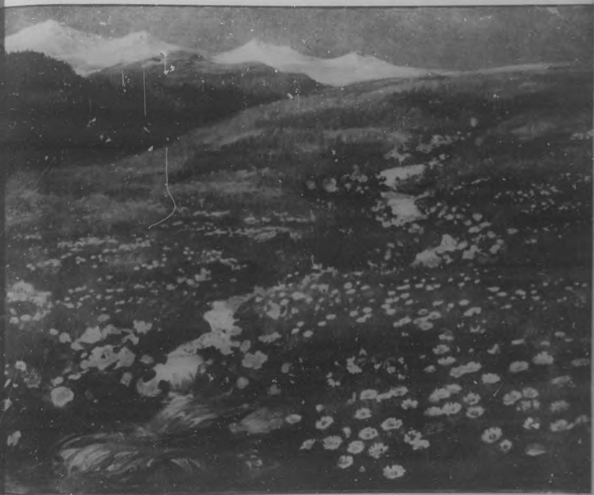
EL ARROYO Oleo de A. Maller.