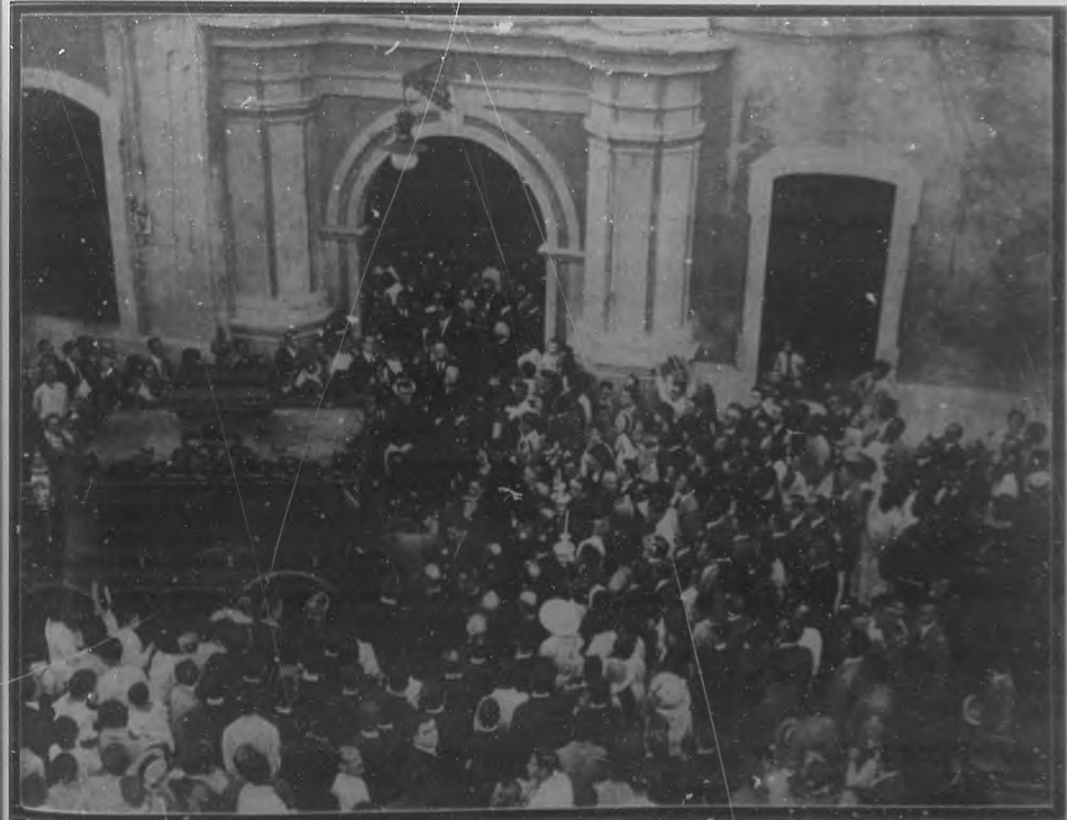
Momentos en que el cadáver del padre Morán era sacado del Colegio de Belén, en hombros de sus compañeros y discípulos.