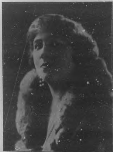
BETTINA FREEMAN.—Eminente soprano dramático de la compañía de ópera "Cosmopolitan", que debutará el día 14 de diciembre en el teatro "Payret".