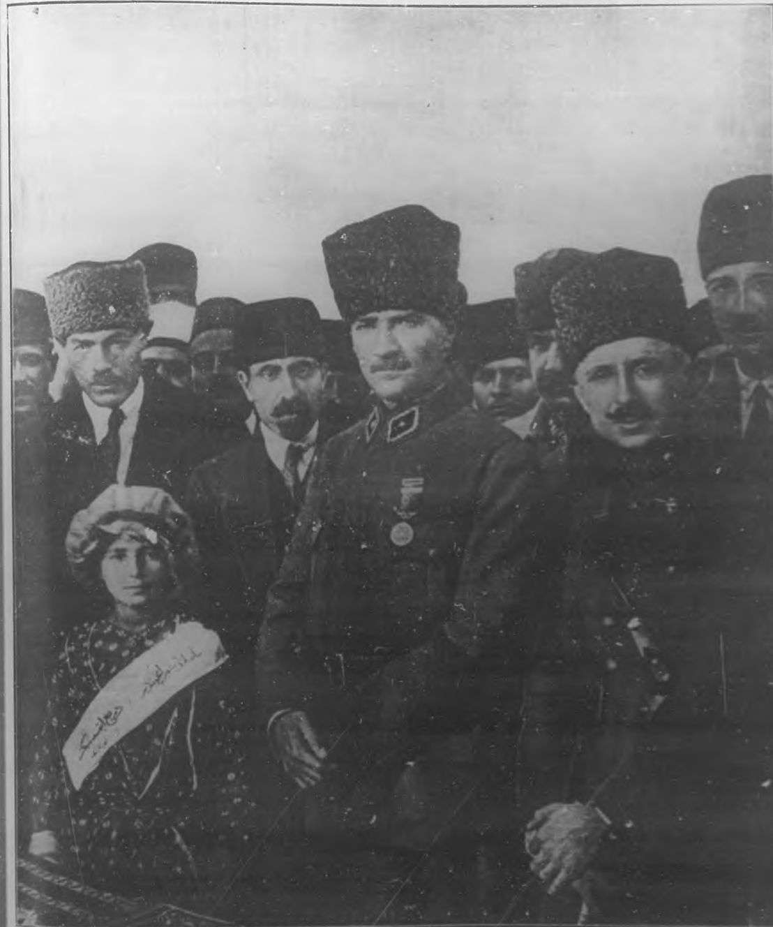
Mustapha Kemal Pasha (al centro), el “leader” nacionalista turco que recientemente expulsó al ejército griego del Asia Menor. Este hecho ha convertido a Mustapha Kemal en el ídolo del ejército y del pueblo turcos.