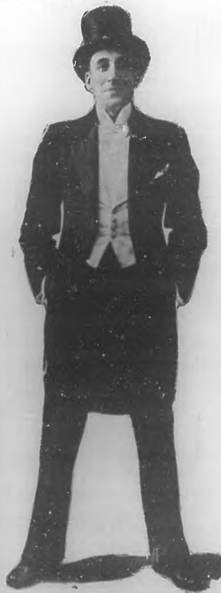
ALEGRIA El estupendo malabarista que actúa en "Payret".

Treinta y cinco coristas y cuarenta profesores de orquesta: