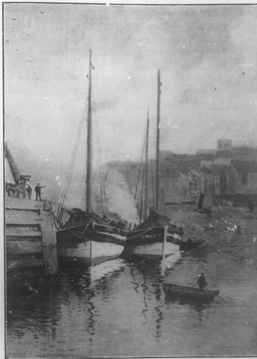
LAS BARCAS Acuarela de A. Barrat.

Pero en medio de todos mis dolores brillará con fulgentes majestades su recuerdo triunfal lleno de amores.