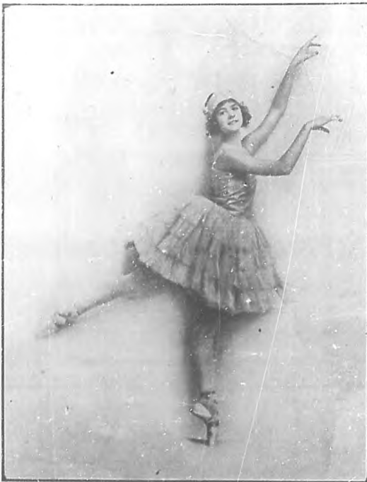
HELENE DENIZON.—Joven y notable bailarina a quien la crítica señala como la sucesora de la Pavlova y que se presentará por primera vez ante nuestro público, el próximo jueves en el teatro "Nacional".

Yo auguro a la gentil Helene y al amable James, —dos legítimas glorias del arte coreográfico internacional— un éxito rotundo en estas latitudes donde lo bue-