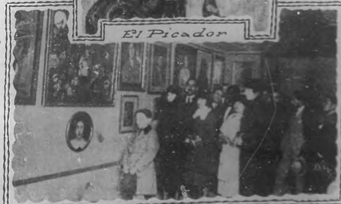
La Exposición Campo Hermoso en Madrid

do la pintura". Yo tengo varias obras inspiradas en la vida y en las cosas del torero. La plaza de toros es un campo muy fecundo en asuntos pictóricos, por la mucha luz, color y movimiento que allí podemos encontrar.