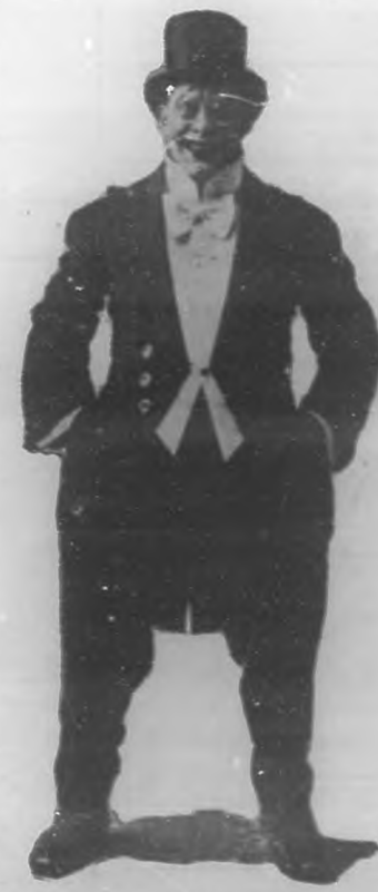
ENHART El maravilloso "clown" que en "Payret" trabaja.